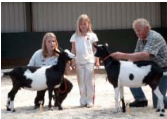
Geitenkeuring - Assendelft 2003

Een verenigingskeuring wordt jaarlijks in de Manege "de Delft" te Assendelft gehouden. Hier wordt de geit onder de brede aandacht van het publiek gebracht. Door deskundige NOG keurmeesters wordt de geitenstapel geëvalueerd. Zij bekijken alle geiten op hun goede en minder goede kwaliteiten en op rasgebonden eigenschappen. Soms, meestal op aanvraag, wordt een advies gegeven. De beste geiten komen voorop te staan.