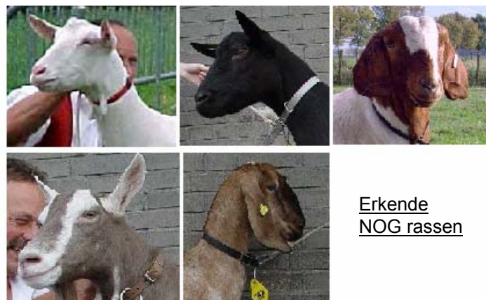
Erkende NOG rassen

Geïnteresseerd, neem dan contact op met onze secretaris: