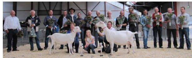
Algemene Nationale kampioenen 2011 in Barneveld