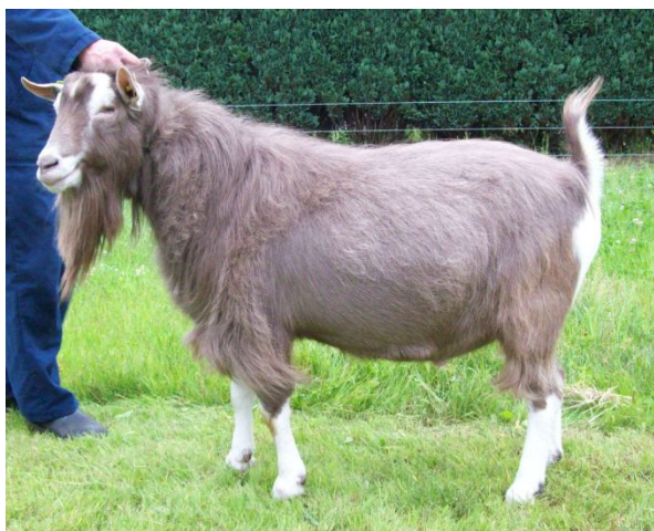
Sweelhoeve Diablo, Fokkers/eigenaren: gebr. Popken